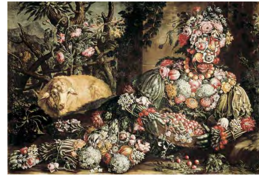
Giuseppe Arcimboldo, Der Frühling (The Spring)

Beschreibung: das Bild wird maßstabsgetreu vergrößert (175 cm breit und 120 cm hoch), das vergrößerte Bild wird von einem feinmaschigen Metallgitter eingerahmt, die Bildteile werden ausgearbeitet und am vorbereiteten Metallgitterrahmen befestigt (z.B. das Knie der liegenden Figur, auf dem Bild als weißer Blumenstrauß dargestellt, wird als weißer Blumenstrauß dreidimensional aus Recyclingmaterial ausgearbeitet werden)